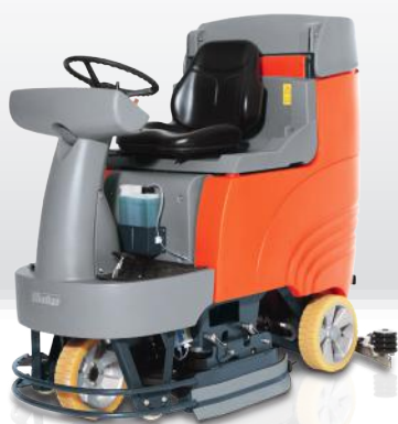
Scrubmaster B115 R schijfborstel