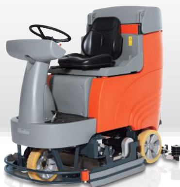
Scrubmaster B115 R walsborstel