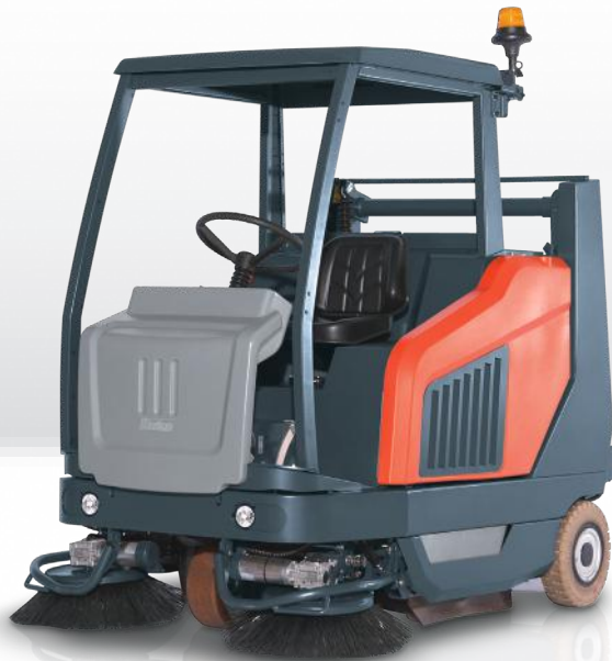
Sweepmaster B1500 RH met als optie het veiligheidsdak