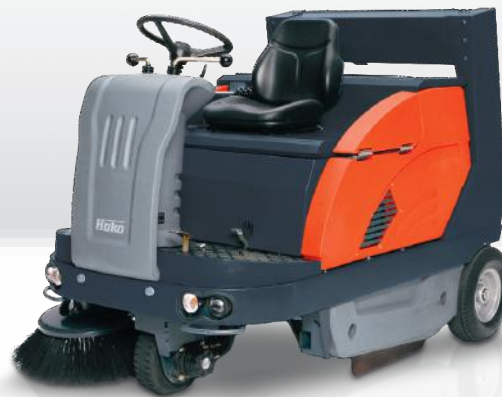
Sweepmaster P1200 RH