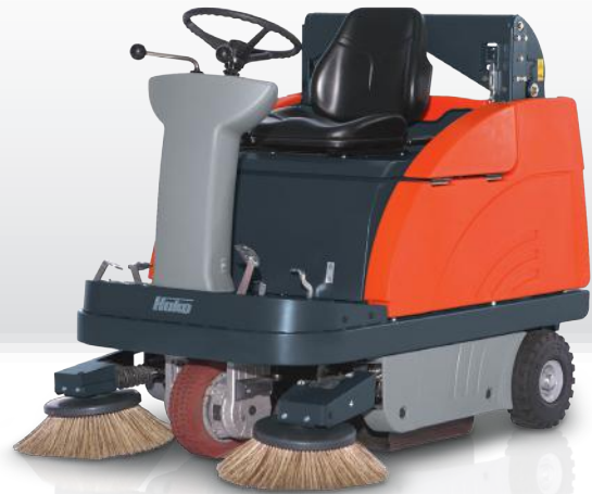
Sweepmaster B980 RH