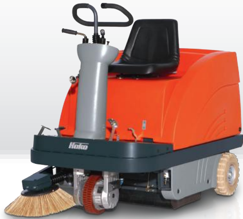
Sweepmaster B900 R