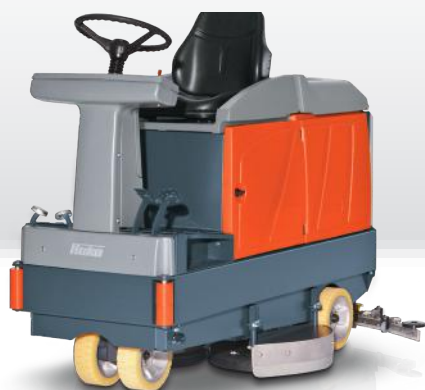
Scrubmaster B140 R