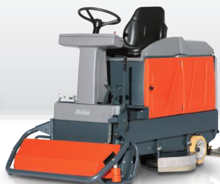
Scrubmaster B140 R